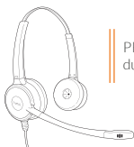
PRIME HD duo NC