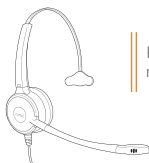
PRIME HD mono NC